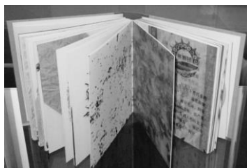
S motivy čaje